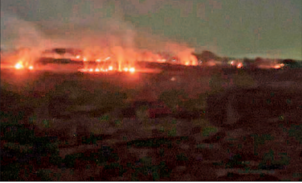
पाया। ग्राम पटवारी, कोटवार आदि भी तत्काल पहुंचकर आग बुझाने में

पूर्व मंत्री के रिश्तेदार के यहां करोड़ों के लेनदेन की हो रही जांच