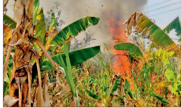
की गई। ग्राम पंचायत ने फायर ब्रिगेड बुलाकर आग पर काबू

ग्राम छाती में 24 अप्रैल शुरुवार को दोपहर अज्ञात व्यक्ति द्वारा आग लगाने से खेतों की आग बाढ़ी एवं घर की ओर पहुंचने लग गया। भीषण गर्मी और हवा से फैले भयंकर आग के धुआं को गांव में देखकर अफरातफरी मच गई। गांव के लोग पानी लेकर बुझाने में लगे रहे। ग्राम पंचायत छाती द्वारा मुनादी करा कर नल जल पानी खोलकर पानी से आग बुझाने की मशकत