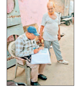
शामिल कर उन्हें तकनीकी रूप से दक्ष बनाया जाएगा, ताकि वे जनगणना कार्य को सुचारू रूप से

साथ ही आसपास के ग्राम अर्जुनी, रत्नाबांधा, मुजगहन और करेठा में कुल 24,114 भवनों को चिन्हित कर उन्हें एक विशिष्ट नंबर प्रदान किया गया है। इस नंबरिंग के जरिए प्रत्येक मकान को डिजिटल पहचान दी गई है, जो आगामी सर्वे और जनगणना कार्य में महत्वपूर्ण भूमिका निभाएगी। प्रशासन अब दूसरे चरण की तैयारियों में जुट गया है। इसके तहत प्रणाली और पर्यवेक्षकों को प्रशिक्षित करने के लिए विशेष कार्यक्रम आयोजित किया जाएगा। प्रशिक्षण में व्याख्याताओं को